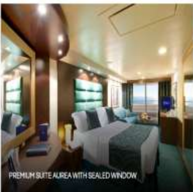
PREMIUM SUITE AIREA WITH SEALED WINDOW