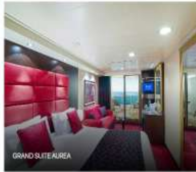
GRAND SUITE AIREA