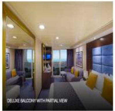
DELUXE BALCONY WITH PARTIAL VIEW