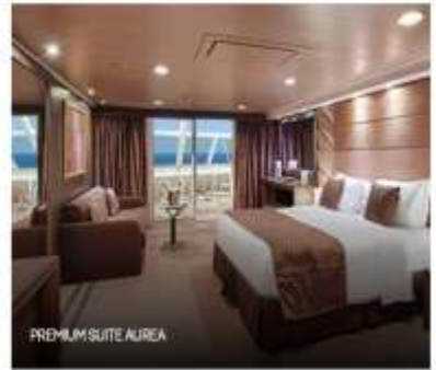
PREMIUM SUITE AIREA