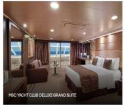
MSC YACHT CLUB DELUXE GRAND SUITE