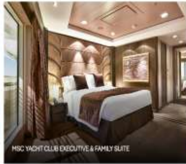
MSC YACHT CLUB EXECUTIVE & FAMILY SUITE