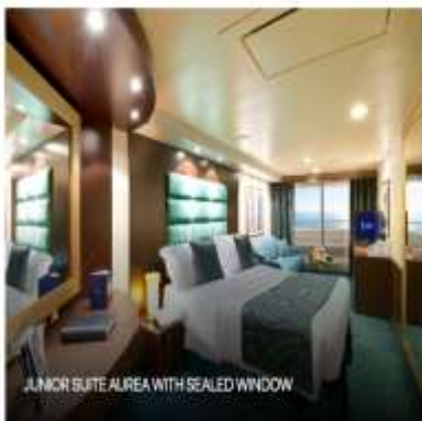
JUNIOR SUITE AIREA WITH SEALED WINDOW