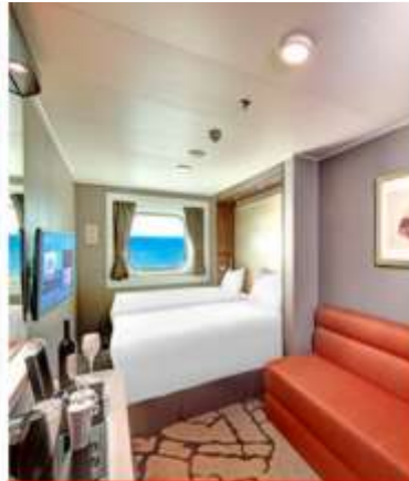
Oceanview Stateroom with Window