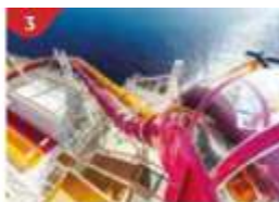
Waterslide Park Get drenched in fun on one of our six different waterslides.