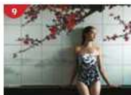
Crystal Life™ Spa Rejuvenate mind, body and soul with our holistic Western and Asian spa experience.