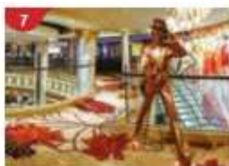
Johnnie Walker House™ Immerse yourself in the intricate world of premium Scotch whisky.