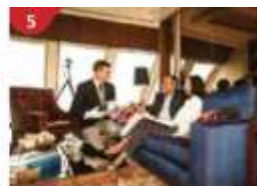
The Palace Indulge in European-style butler service and exclusive facilities.