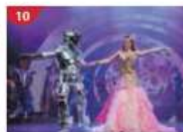
Zodiac Theatre Enjoy live production shows from the acclaimed award-winning entertainment team.

**เรือจะมีใบแจ้งสถานที่และเวลาที่ห้องพักของท่านเพื่อนให้ท่านรับหนังสือเดินทางคืน