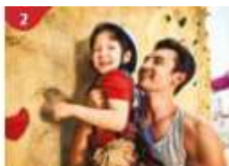
Rock Climbing Wall Challenge yourself on our mountainous rock climbing wall.