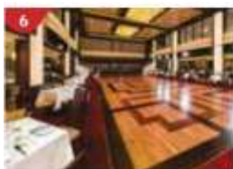
Dream Dining Room Savour a wide variety of Asian and international cuisine.