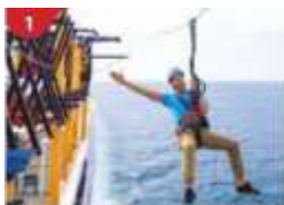
Ropes Course & Zipline Feel the thrill of gliding above the ocean on a 35-metre zipline.

ถ้าท่านประสงค์จะถือกระเป๋าเดินทางลงด้วยตัวเองไม่จำเป็นต้องวางไว้ที่หน้าห้องพัก