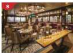
Bistro By Mark Best Relish contemporary Western cuisine from the internationally-acclaimed Australian chef.