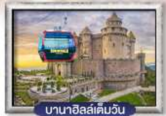
บาน่าฮิลล์เต็มวัน