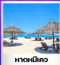
หาดหมีคว