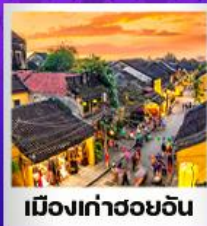
เมืองเก่าฮอยอัน