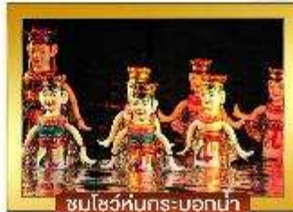
ชมโชว์หุ่นกระบอกน้ำ