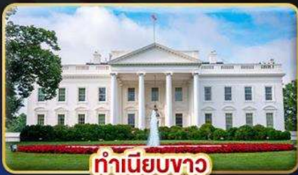
ทำเนียบขาว