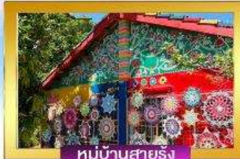
หมู่บ้านสายรุ้ง