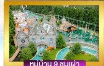
หมู่บ้าน 9 ชนเผ่า