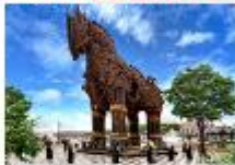
เมืองขานัคคาเล่

** พักที่ Buyuk Truva Hotel 4* หรือเทียบเท่า **