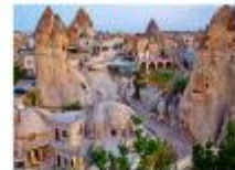
คาราวานสโรน