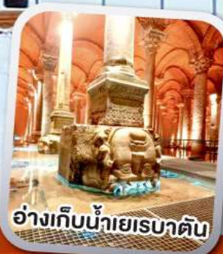
อ่างเก็บน้าเยรบาดัน