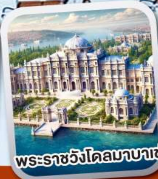
พระราชวังโดลมาบาเซ่