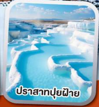
ปราสาทปุยฝาย