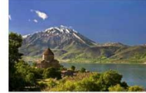
เมืองวาน