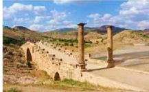
สะพานเซเวอร์ริน