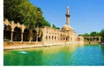
ถ้ำอับราฮัม