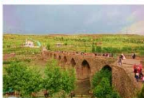
สะพานสิบโค้ง