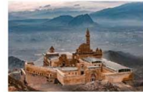
พระราชวังอิซฮาก พาชาร์