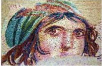
พิพิธภัณฑสถานแห่งชาติซูมา โมเสก