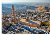
เมืองมาร์ดิน