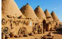
บ้านแบบรวงผึ้ง