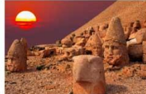
ชมพระอาทิตย์ตกดิน