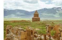
เมืองเอนิชม

15.25-17.50 น. เห็นฟ้ากลับสู่อิสตันบูล โดยสายการบิน TURKISH AIRLINES เที่ยวบินที่ TK 2717 (บินภายในประเทศ)