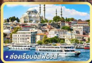
• ล่องเรืออิสฟอรุส