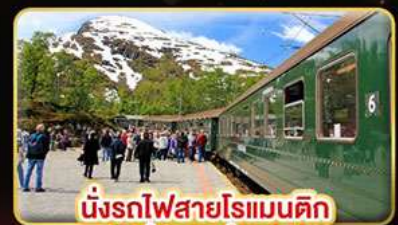
นั่งรถไฟสายโรแมนติก “พร้อมสปาเนา”