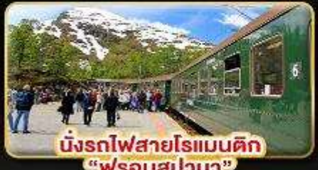
นั่งรถไฟสายโรแมนติก "ฟรอมสมาเนา"