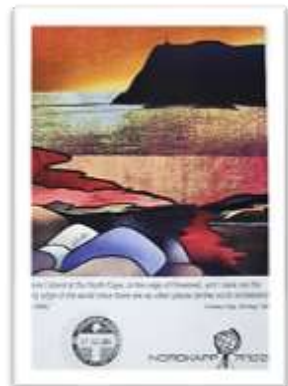
North cape Certificate

• เมืองอัลตา (Alta) ตั้งอยู่ทางเหนือของนอร์เวย์ ห่างจาก Artic Circle ราว 375 กิโลเมตร ทำให้ที่นี่มีอากาศหนาวเย็นสุดขั้วในช่วงฤดูหนาว แต่ก็มีความอบอุ่นขึ้นมาหน่อยในช่วงฤดูร้อน นอกจากการชม แสงเหนือในยามค่ำคืนแล้ว ที่นี่ยังมีงานเทศกาล Finnmarksløpet ซึ่งเป็นการแข่งขันรถลากเลื่อนสุนัขชื่อดังของยุโรปที่จะจัดขึ้นในทุกๆ ปี