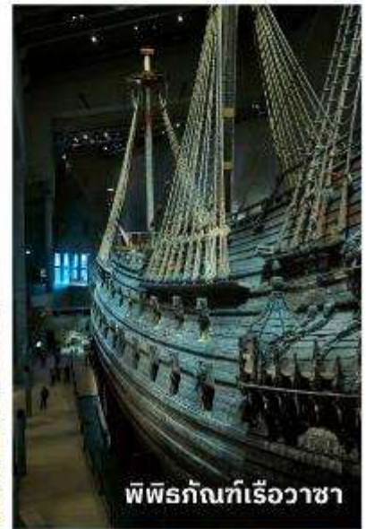
พิพิธภัณฑ์เรือวาซา