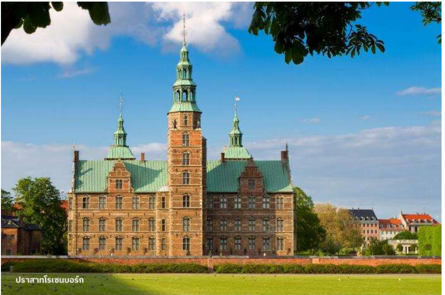
ปราสาทโรเซนบอร์ก