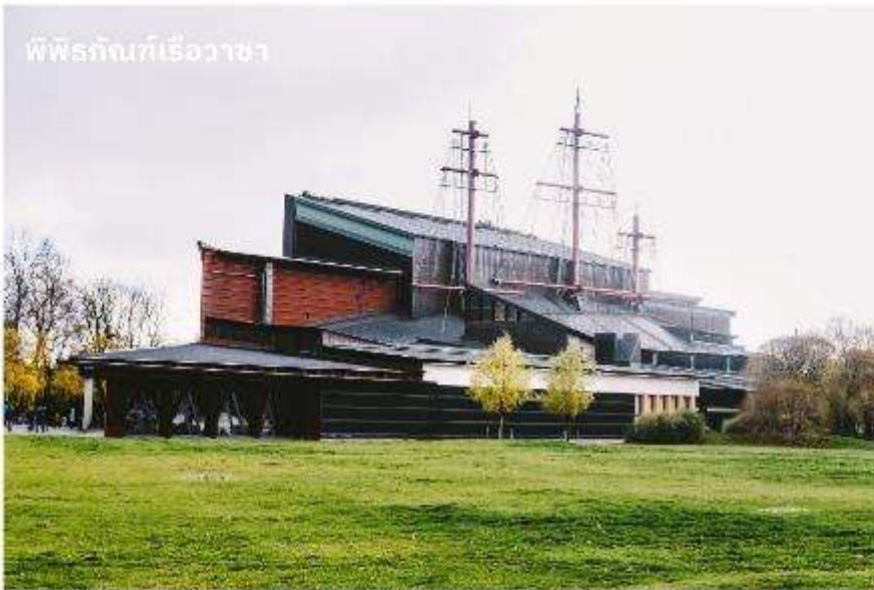
พิพิธภัณฑ์เรือวาซา

จากนั้นนำท่านเข้าชม พิพิธภัณฑ์เรือวาซา ซึ่งตั้งโชว์เรือรบโบราณที่กู้ขึ้นมาได้จากที่ใต้ทะเล และยังคงสภาพที่สมบูรณ์ จัดเป็นพิพิธภัณฑ์ที่มีชื่อเสียงที่สุดแห่งหนึ่งในสต็อกโฮล์ม เรือวาซานั้นสร้างขึ้นเมื่อปี ค.ศ.1628 เพื่อให้เป็นเรือรบที่ใหญ่ที่สุด โดยบรรจุปืนใหญ่ถึง 64 กระบอก แต่เพียงวันแรกก็ออกเดินทางได้ประมาณ 500 เมตร เรือก็จมลงสู่ใต้ทะเลลึก 35 เมตร และในศตวรรษที่ 20 เรือลำนี้ได้ถูกยกขึ้นมาจากใต้ทะเลโดยใช้เทคนิคพิเศษที่มีความทันสมัย และได้นำเรือวาซาลำดังกล่าวมาจัดแสดงเป็นพิพิธภัณฑ์ ทุกท่านจะได้พบกับเรือ Vasa ขนาดใหญ่ และจะได้ชมโครงสร้างของเรือ, ประวัติของการสร้างและสถานการณ์ที่ทำให้เรือล่มลง รวมถึงเรียนรู้เรื่องราวต่างๆ ที่เกี่ยวข้องกับ Vasa ได้อย่างลึกซึ้ง