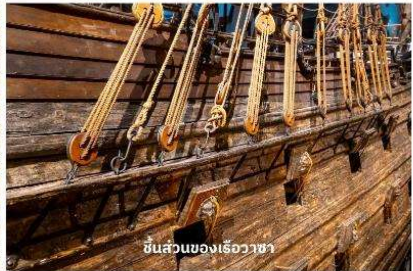
ชิ้นส่วนของเรือวาซา