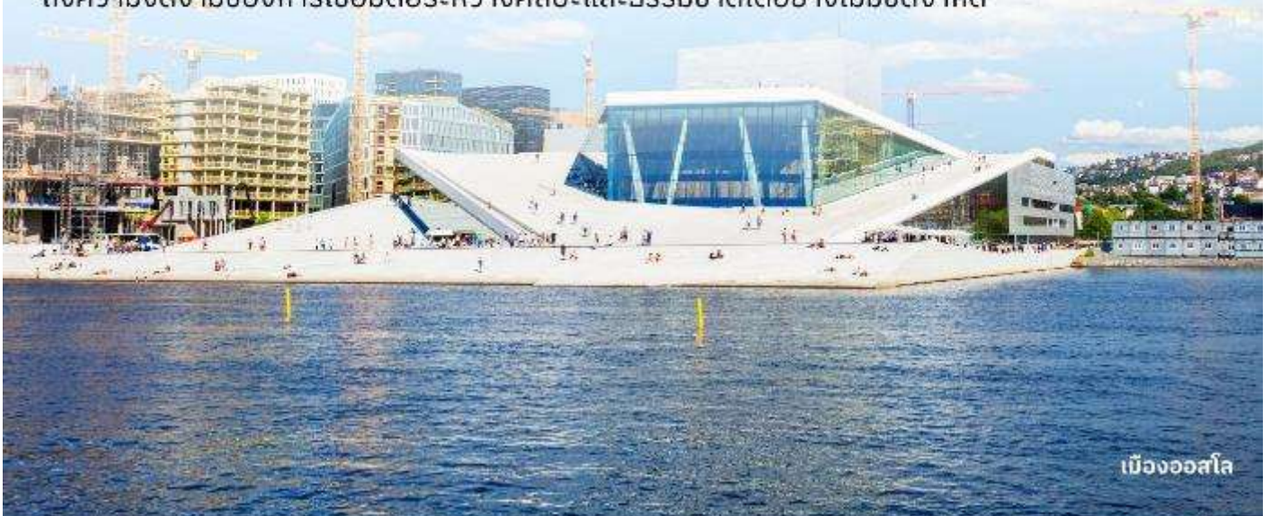
เมืองออสโล

นำท่านถ่ายรูป Operahuset ในออสโล (Oslo Opera House) เป็นสถาปัตยกรรมที่มีความเป็นเอกลักษณ์อย่างมาก สร้างบนพื้นที่แหลมที่สวยงามของกรุงออสโล ทุกท่านจะได้ประสบการณ์ที่สะท้อนถึงความงดงามของการเชื่อมต่อระหว่างศิลปะและธรรมชาติได้อย่างไม่มีขีดจำกัด