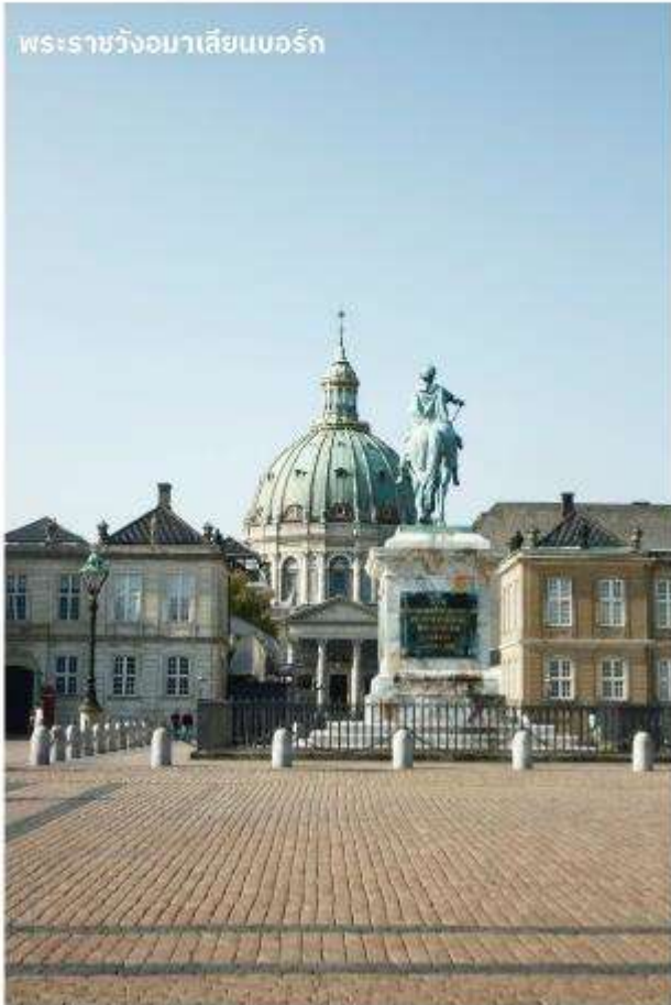
พระราชวังอมาเลียนบอร์ก