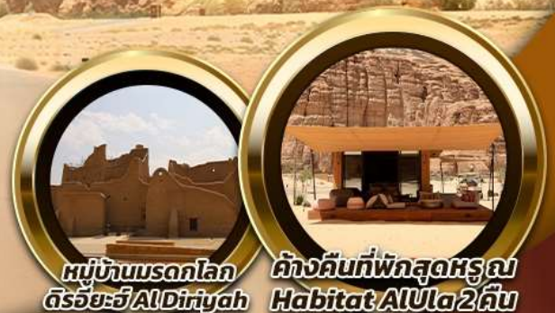
หมู่บ้านมรดกโลก Diriyah Habitat AlUla 2คืน

บินหรู อยู่สบาย เที่ยวบินดี ซิลด์ ซิลด์ 10 ท่าน คอนเฟิร์มเดินทาง