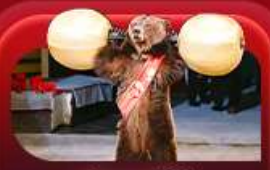
ชมละครสัตว์

สองเมืองไฮไลท์ของรัสเซียที่ไม่ควรพลาด! ตื่นตาตื่นใจกับมหาวิหารเซนต์บาซิล ชมความยิ่งใหญ่ของจัตุรัสแดง สัมผัสอดีตที่พระราชวังเครมลิน ชมความงามของสถานีรถไฟใต้ดินมอสโก ซาครัส โบสถ์โกลิถัณนีดี เนินเขาสเปร์โร ชมความงามพระราชวังฤดูหนาว พิพิธภัณฑ์ฮอร์มิกง ชมละครสัตว์ (Circus Show) ป้อมปิเตอร์แอนด์ปอล และมหาวิหารเซนต์ไอแซค