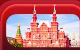
จัตุรัสแดง