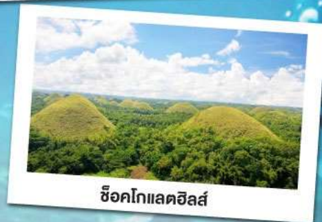
ช็อคโกแลตฮิลล์