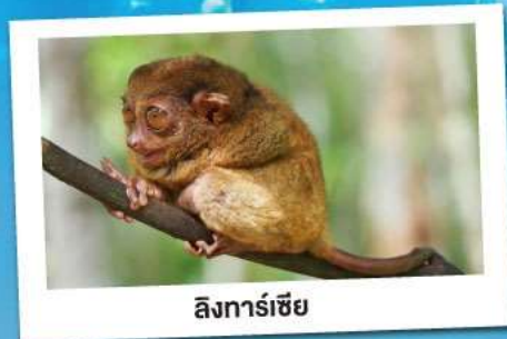
ลิงการ์เซียร์