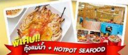
พิเศษ!! ก๊วยแม่น้ำ + HOTPOT SEAFOOD