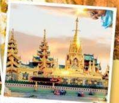
เจดีย์กลางน้ำ (สิเรียม)