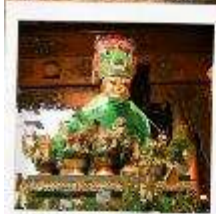
ขอพรแม่ย่า

สักการะ 3 มหาบูชาสถาน ที่สุดแห่งศรัทธาของชาวพุทธ