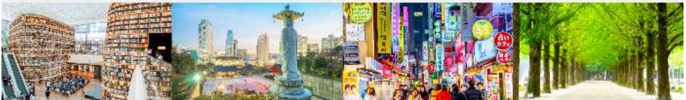
STARFIELD COEX MALL