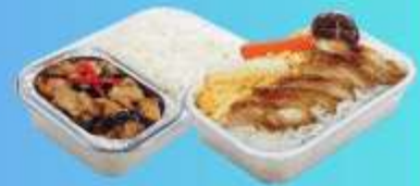
บริการอาหารร้อนบนเครื่อง ขาไป - ขากลับ