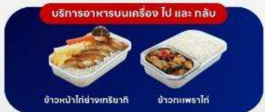
บริการอาหารบนเครื่อง ไป และ กลับ