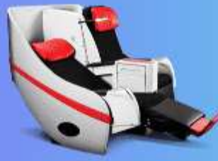
พรีเมียมแฟลตเบด