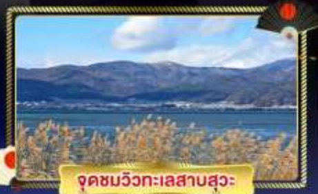
จุดชมวิวกะเลสาบสุวะ