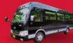
BUS (10-18 ท่าน)