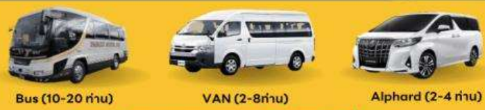
Bus (10-20 ท่าน) VAN (2-8ท่าน) Alphard (2-4 ท่าน)

สำหรับท่านที่ต้องการความเป็นส่วนตัวมากขึ้น ท่านสามารถเลือกใช้บริการ รถส่วนตัวได้ โดยมีรูปแบบรถให้เลือกถึง 3 ประเภท โดยรถ แต่ละประเภท สามารถนั่งได้ตั้งแต่ 2 ท่านขึ้นไป