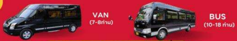
VAN (7-8ท่าน) BUS (10-18 ท่าน)

สำหรับท่านที่ต้องการความเป็นส่วนตัวมากขึ้น ท่านสามารถเลือกใช้บริการ รถส่วนตัวได้ โดยมีรูปแบบรถให้เลือกถึง 2 ประเภท โดยรถ แต่ละประเภท สามารถนั่งได้ตั้งแต่ 2 ท่านขึ้นไป