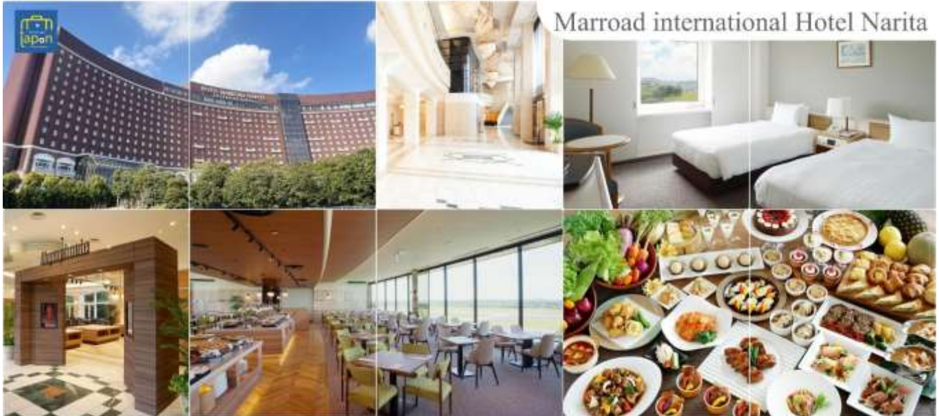
Marroad international Hotel Narita