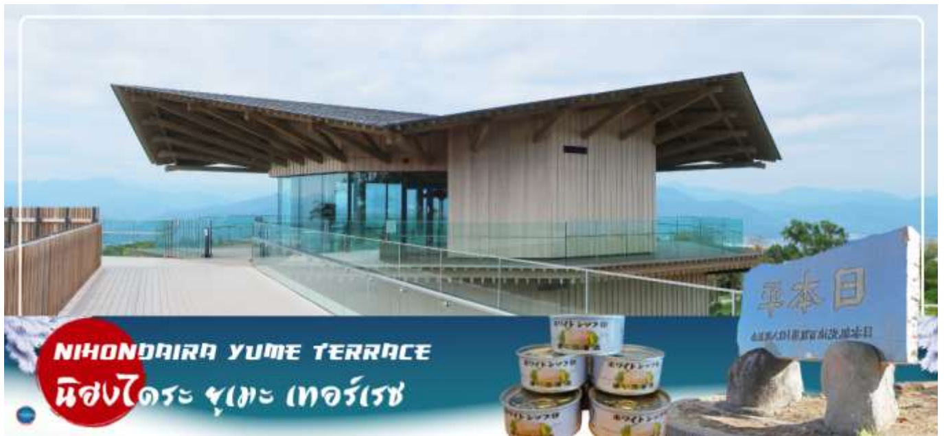
NIHONDAIRA YUME TERRACE นิสงไดระ ยูเมะ เทอร์เรซ