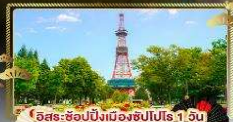
🗼 อิสระช้อปปิ้งเมืองซัปโปโร 1 วัน