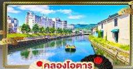
🚢 คลองโอตารุ