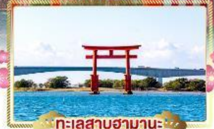
ทะเลสาบฮามานะ