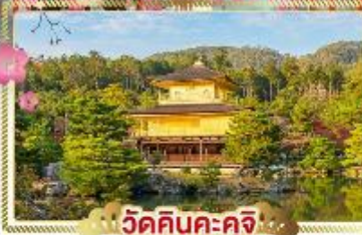
วัดคินคะคุจิ