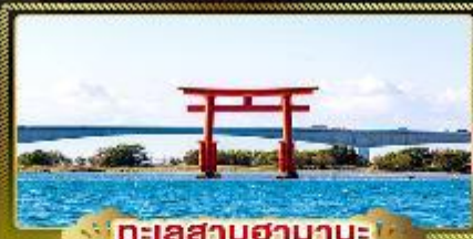
ทะเลสาบฮามานะ