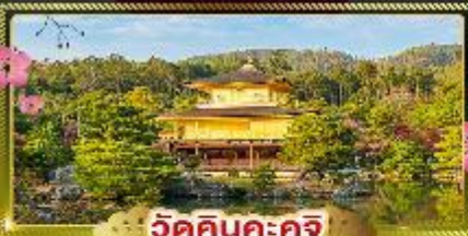
วัดคินคะคุจิ

นั่งรถไฟความเร็วสูง NAGOYA - MIKAWA ANJO