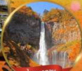
น้ำตกเคกอน