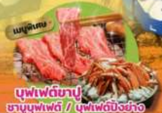
บุฟเฟ่ต์ชาบู ชาบูบุฟเฟ่ต์ / บุฟเฟ่ต์บิงชัง