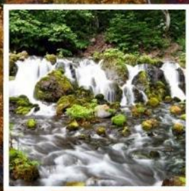
สวนฟูจิตาชิพาร์ค