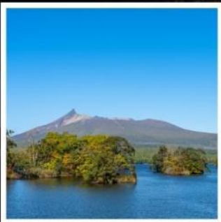
อุทยานแห่งชาติโอโนมะ