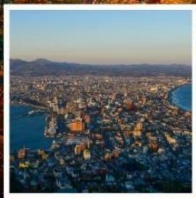
กระเช้าภูเขาฮาโกดาเตะ