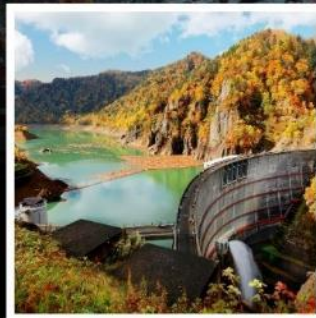
สันเขื่อนโอเฮเคียว