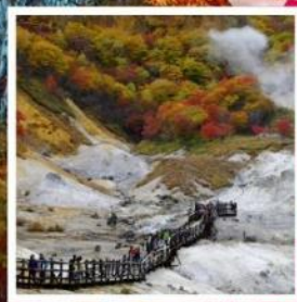
หุบเขานรก จิโคะคุดาบิ