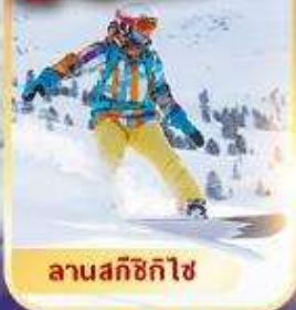
ลานสกีซิกิไซ