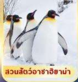
สวนสัตว์อาซาฮิยาม่า