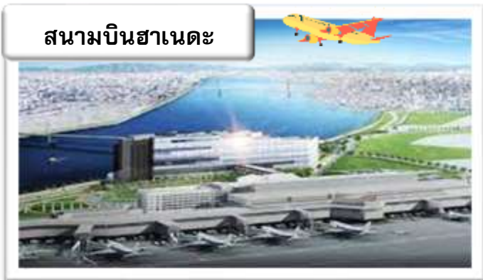
สนามบินฮานอย

22.45 น. ออกเดินทางสู่ สนามบินฮานอย ประเทศญี่ปุ่น โดย สายการบินไทย เที่ยวบินที่ TG 644