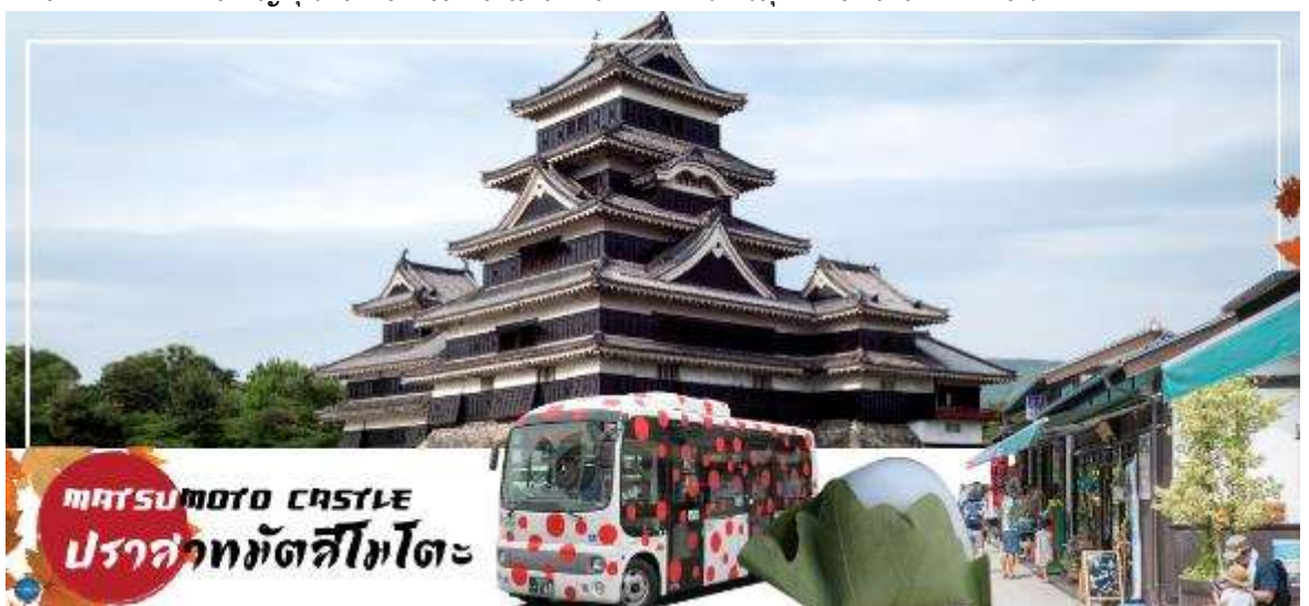
MATSUMOTO CASTLE ปราสาทมัตสึโมโตะ

นำท่านชม ปราสาทมัตสึโมโตะ (Matsumoto Castle) (ด้านนอก) เป็น 1 ใน 12 ปราสาทดั้งเดิมที่ยังคงสภาพสมบูรณ์และสวยงามที่สุดของประเทศญี่ปุ่น และเป็น 1 ใน 5 ปราสาทที่ได้รับการขึ้นทะเบียนเป็นสมบัติประจำชาติ เป็นปราสาทที่สร้างอยู่บนพื้นที่ราบ มีเอกลักษณ์ตรงที่มีหอคอยและป้อมปืนเชื่อมต่อกับโครงสร้างอาคารหลัก และเนื่องจากผนังปราสาทมีสีดำและปีกด้านต่างๆ ของปราสาทแผ่กางออกเหมือนปีกนก เลยมีชื่อเรียกว่า คาราซุโจ ที่แปลว่า ปราสาทอึกา สำหรับข้างในตัวปราสาทมีชั้นบันไดสูงชันและเพดานที่ไม่สูงมาก บริเวณทางเดินจัดแสดงวัสดุเครื่องใช้ทางประวัติศาสตร์ เช่น ชุดเกราะซามูไรสมัยเซ็นโกกุ, ปืนคาบศิลาและอาวุธที่เคยใช้สู้รบในสมัยก่อนหน้าต่างเป็นหน้าตาต่างไม่แคบๆ มีช่องสำหรับยิงปืนและยิงลูกธนู ท่านสามารถเพลิดเพลินกับทัศนียภาพของเทือกเขาแอลป์ญี่ปุ่นและเมืองมัตสึโมโตะได้จากชั้นบนสุดของปราสาทแห่งนี้