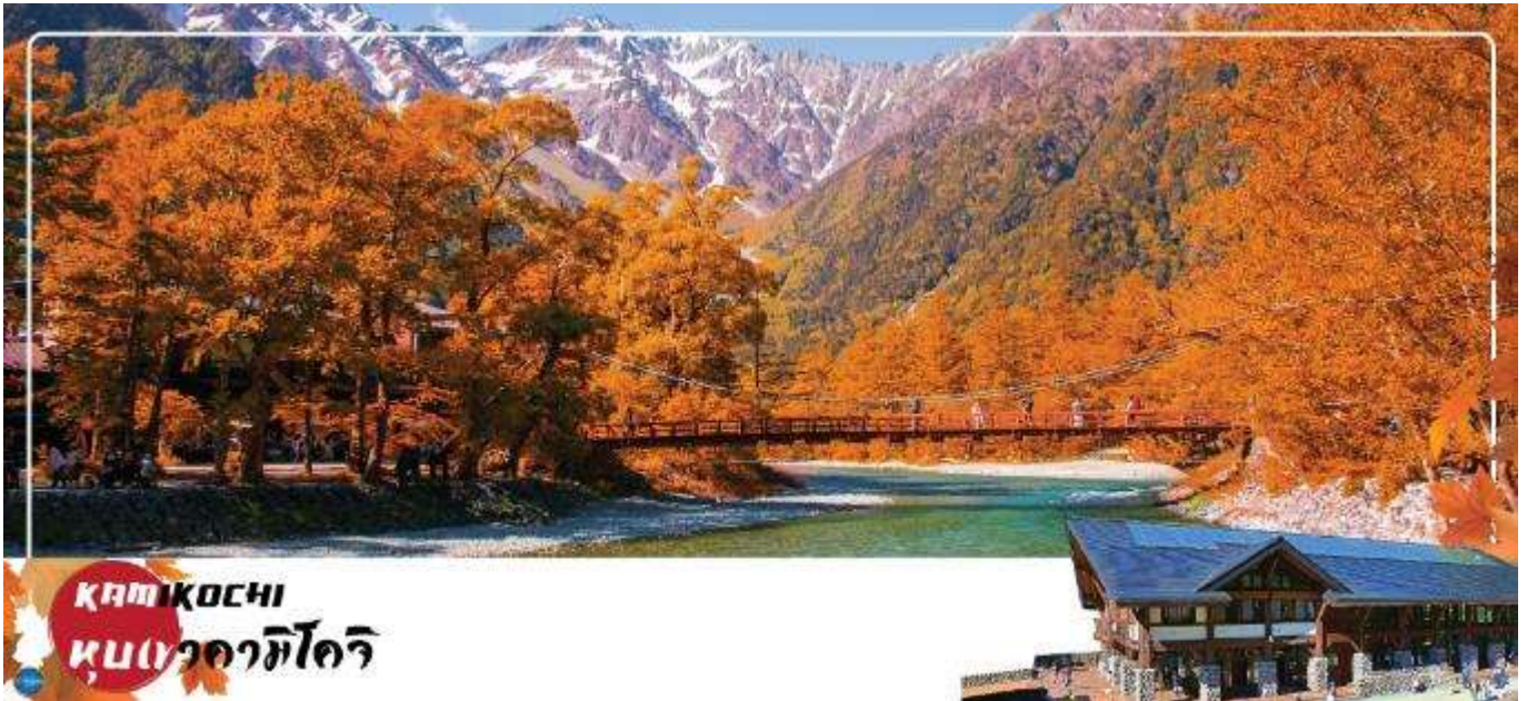
KAMIKOCHI หุบเขาคิโตะ

จากนั้นนำท่านเดินทางสู่ คามิโคจิ (Kamikochi) (ใช้เวลาเดินทางประมาณ 50 นาที) แหล่งท่องเที่ยวทางธรรมชาติที่มีทิวทัศน์เขาที่สวยงามที่สุดแห่งหนึ่งของประเทศญี่ปุ่น ดินแดนแห่งธรรมชาติท่ามกลางหุบเขาแสนสวยของเทือกเขา "เจแปน แอลป์" (Japan Alps) เป็นหุบเขาในพื้นที่อยู่สูงขึ้นไปทางเหนือของเทือกเขาแอลป์ญี่ปุ่น ภาพสายน้ำของแม่น้ำอะซุสะ ที่ใสสะอาดไหลผ่านสะพานคัปปะ ล้อมรอบด้วยต้นป่าเขียวขจี และฉากหลังของยอดเขาสูงตระหง่านระดับ 3,000 เมตรให้ท่านได้เพลิดเพลินกับการเดินเล่นสบายๆ ไปกับธรรมชาติที่สวยงาม อิสระให้ท่านได้เก็บภาพความประทับใจตามอัธยาศัย สะพานคัปปะ-บะชิ เป็นจุดที่มีคนเยอะที่สุดในคามิโคจิ และในบางครั้งก็ให้ความรู้สึกเหมือนทางแยกที่มีชื่อเสียงของชินยยะ มีผู้คนมากมายเดินข้ามไปข้ามมาอยู่ไม่หยุดหย่อน มาถ่ายรูปใกล้กับสะพานหรือบนสะพาน