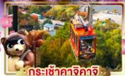
กระเช้าคาจิคาจิ