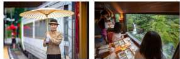
พิเศษ รับประทานอาหารกลางวันบนรถไฟ กับวิวธรรมชาติหลักล้าน

(รูปภายในรถไฟอาจมีการเปลี่ยนแปลง โดยไม่จำเป็นต้องแจ้งให้ทราบล่วงหน้า)