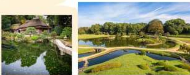
รับประทานอาหารกลางวัน ณ กิตตาคาร

นำท่านชม "ปราสาทโอคายาม่า" สร้างขึ้นในปีค.ศ. 1597 โดย อูคิตะ ฮิเดอิโระ คำนวณปราสาทถูกตกแต่งด้วยไม้กระดานเคลือบเงาสีดำ ทำให้ปราสาทนี้ได้รับฉายาว่า "ปราสาทอึกิ" เนื่องจากหอคอยหลักของปราสาทถูกเผาทำลายเสียหายจากภัยสงคราม จึงได้รับการบูรณะสร้างขึ้นใหม่อีกครั้ง ด้วยธรรมชาติที่ร่มรื่นและมีความสวยงามอย่างลงตัวทำให้นักท่องเที่ยวจากทั่วโลกต่างเดินทางมาชื่นชมความงดงามของปราสาทแห่งนี้