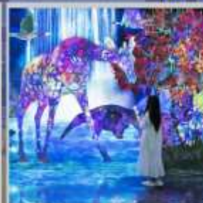
"TEAM LAB FOREST"