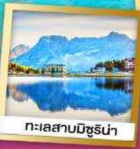
ทะเลสาบมิซูรีน่า