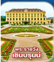
พระราชวัง เซินบรุนน์