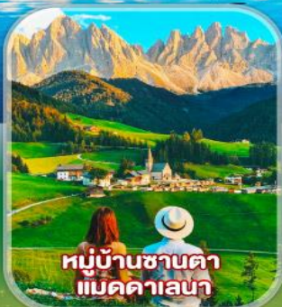
หมู่บ้านซานตา แม็คคาเลนา