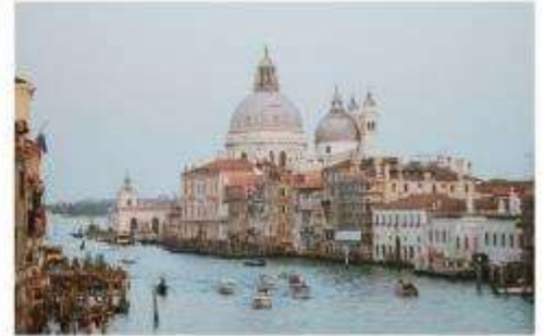
แตรนด์คาแนล

นำทุกท่านนั่งเรือต่อเพื่อไปยัง ท่าเรือซานมาร์โค (San Marco Pier) บนเกาะเวนิส แวะให้ท่านถ่ายรูปสวยๆ เก็บเป็นที่ระลึกกันที่ พระราชวังดอดจ์ พระราชวังริมน้ำแสนอลังการ ที่สร้างตั้งแต่ศตวรรษที่ 14 ในสไตล์เวเนเซียนโกธิค ที่เคยเป็นที่ประทับของผู้ปกครองของเวนิส แต่ตั้งแต่ปี 1923 ก็ได้เปลี่ยนเป็นพิพิธภัณฑ์ให้คนทั่วไปได้เข้าชม เป็นหนึ่งในแลนด์มาร์คหลักของเวนิส จากนั้นเดินเที่ยวชมแลนด์มาร์คสำคัญต่างๆ ในเมือง จัตุรัสเซนต์มาร์ค เป็นจัตุรัสหลักของเมืองเวนิส และยังเป็นศูนย์กลางเมืองตั้งแต่โบราณ จากนั้นนำท่านถ่ายรูปกับ มหาวิหารเซนต์มาร์ค มหาวิหารใหญ่ ของศาสนาคริสต์นิกายโรมันคาทอลิก อลังการด้วยการตกแต่งด้วยโดมใหญ่ และที่อยู่ติดกันและโดดเด่นด้วยความสูงถึง 50 เมตรก็คือ หอรบั้ง ถือเป็นหนึ่งในสัญลักษณ์ของเมืองที่ เห็นได้ไม่ว่าจะอยู่มุมไหนของเมืองก็ตาม และที่พลาดไม่ได้เลยก็คือ สะพานถอนหายใจ สะพานอันโด่งดังแห่งนี้ตั้งอยู่เหนือแม่น้ำที่คั่นกลางระหว่างคูเก่ากับพระราชวังดอดจ์