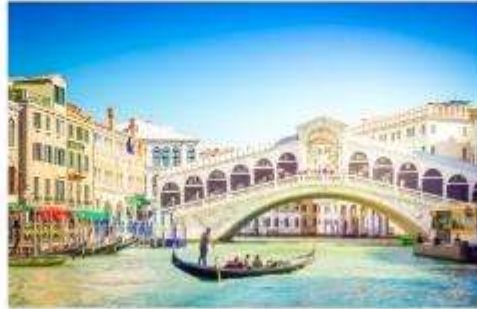
สะพานริอัลโต