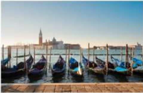
เรือกอนโดล่า

นำท่านออกเดินทางสู่ ท่าเรือตรอนเคโต เพื่อเตรียมตัวนั่งเรือข้ามสู่เกาะเวนิส เกาะเวนิสเป็นดินแดนแสนโรแมนติก เป็นเมืองที่ไม่เหมือนใคร โดยใช้เรือแทนรถ ใช้คลองแทนถนน มีสมญานามว่าเป็น “ราชินีแห่งทะเลเอเดรียติก” มีเกาะน้อยใหญ่กว่า 118 เกาะและมีสะพานเชื่อมถึงกัน กว่า 400 แห่ง