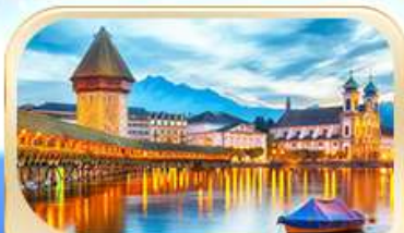
สะพานไมซ์ฮาเปล