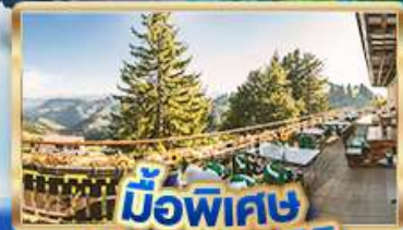
มือพิเศษ บียอดเวนิซ