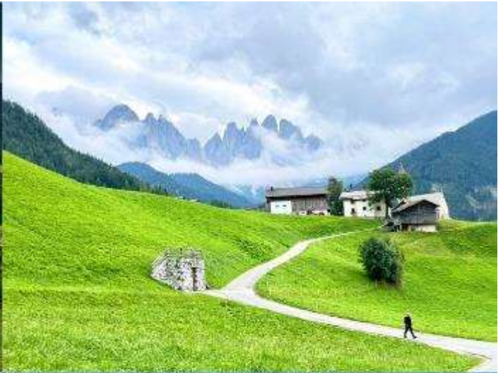
Santa Maddalena - Val di Funes