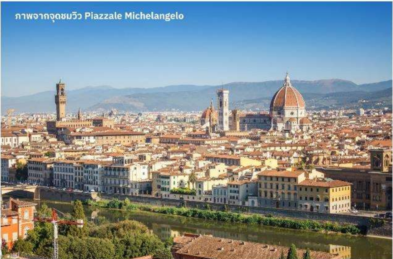
ภาพจากจุดชมวิว Piazzale Michelangelo

เมืองฟลอเรนซ์ ตั้งอยู่ทางตอนเหนือของประเทศอิตาลี เป็นเมืองที่มีชื่อเสียงในช่วงศตวรรษที่ 13-14 ซึ่งเป็นยุคที่เจริญรุ่งเรืองของวัฒนธรรมและศิลปะ อีกทั้งในอดีตยังมีความสำคัญทางการค้าและวัฒนธรรม มีสถาปัตยกรรมที่งดงามและเป็นที่มาของศิลปะ-โรมานติกที่เจริญรุ่งเรืองอย่างมากในยุคนั้น นำท่านเดินทางไปยังเนินเขา Piazzale Michelangelo เพื่อชมวิวของเมือง Florence ที่นักท่องเที่ยวรวมไปถึงชาว Florence เอง มักขึ้นมาชมบรรยากาศในมุมสูงของเมือง ซึ่งจะเห็นหลังคาสีแดงของอาคารบ้านเรือนต่างๆ รวมไปถึง Duomo เรียงรายกันเป็นแนวสวยงามยิ่งนัก อีสาระให้ท่านเก็บภาพประทับใจตามอัธยาศัย