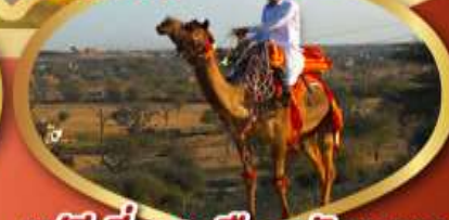
ฟรี ژیوซู เมืองมันทอวา ราคาเริ่มต้น