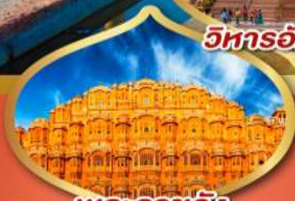
วิหารอักชาร์ดัม