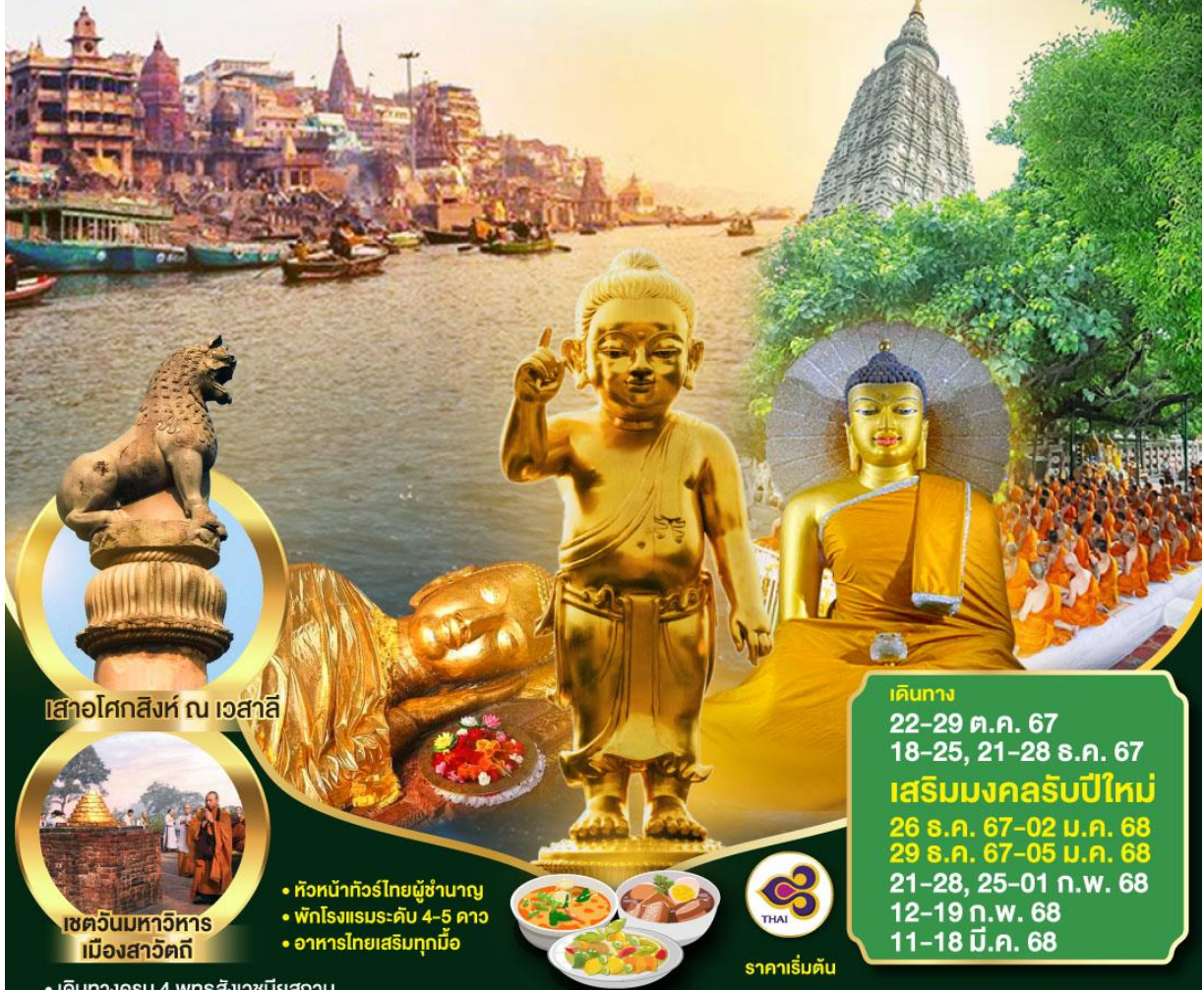
เส้าอโศกสิงห์ ณ เวสาลี