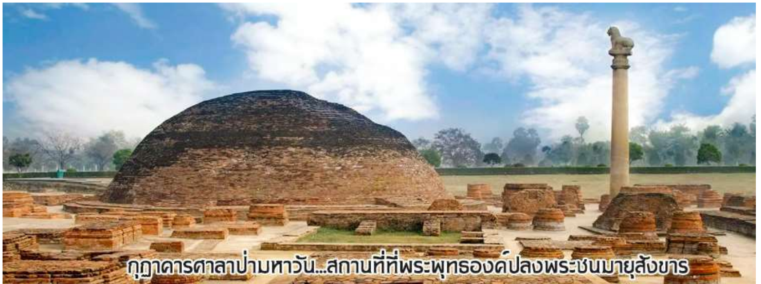
กุฎาคารศาลาป่ามหารวัน...สถานที่ที่พระพุทธองค์ปลงพระชนมายุสังขาร

นำท่านเดินทางต่อสู่เมือง กุสินารา (เดินทางประมาณ 4 ชั่วโมง)เมื่อถึงกุสินาราแล้วเดินทางไป วัดไทยกุสินาราเฉลิมราชย์ วัดนี้สร้างขึ้นเพื่อน้อมเป็นพุทธบูชาและเฉลิมพระเกียรติพระบาทสมเด็จพระเจ้าอยู่หัวในวาระครองสิริราชสมบัติครบ 50 ปี และเฉลิมพระชนมพรรษาครบ 6 รอบ 72 พรรษา พระบาทสมเด็จพระเจ้าอยู่หัวพระราชทานชื่อวัดให้ เชิญท่านร่วมทำบุญตามกำลังศรัทธา