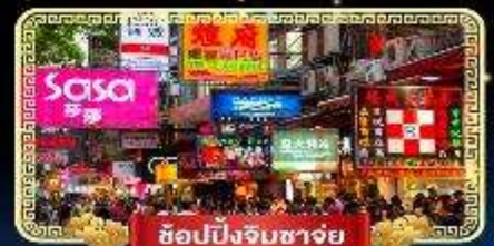
ช้อปปิ้งจิมซาจู้