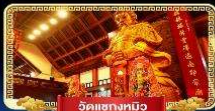
วัดเข่งหมิว