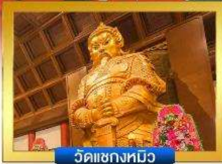
วัดเขangkหมิว

📍 อิสระ-ช้อปปิ้งย่านจิมซาจู้ & คอสเวย์เบย์