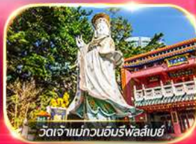
วัดเจ้าแม่กวนอิมพรหลิมเฮ้