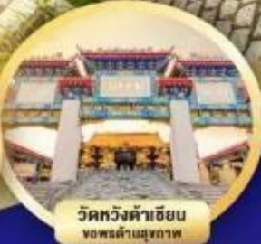
วัดหวังต้าชัย ขอพรด้านสุขภาพ

เมนูพิเศษ.. ห่านย่าง, ต้มชาฮ่องกง และชาบูสโด้ฮ่องกง