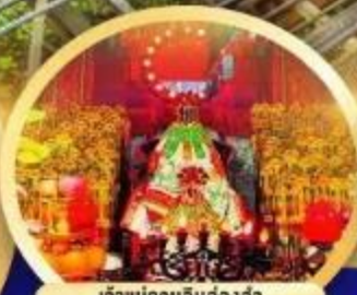
เจ้าแม่กวนอิมองค์อา นับถวายเป็นสิริมงคลกว่า 600 ปี