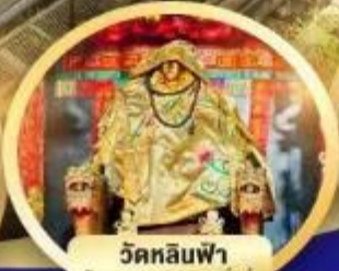
วัดหลินฟ้า โชคลาภและความมั่งคั่ง